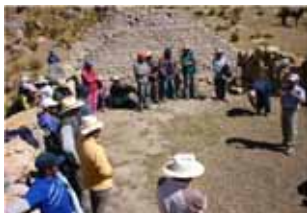
Fortalecimiento de capacidades (practico)