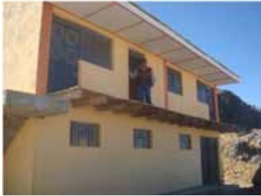
Local multiuso en la comunidad de altoandino, parte del Proyecto "Mejoramiento Genético y Desarrollo de la Crianza de Alpacas en el Distrito de Ascensión"

Población beneficiaria: Los Beneficiarios Directos: 1,727 personas, al concluir el proyecto.