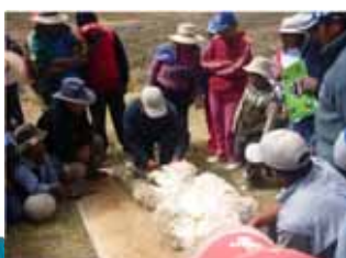
Fortalecimiento de capacidades (practico)