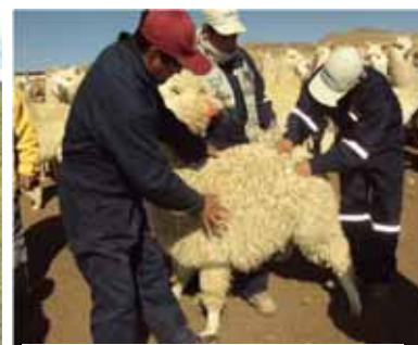
Adquisición de reproductores para el proyecto "Desarrollo de las alpacas en las partes altas del Proyecto Camisea – Huaytara"