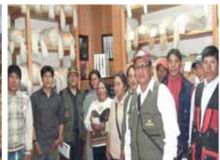
MERCANTIL CON PRODUCTOS ACABADOS