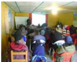
Fortalecimiento de capacidades (teórico), en temas de camélidos sudamericanos silvestres y domésticos