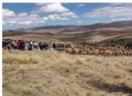
PASANTES PARTICIPANTES EN CHACCU