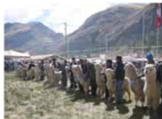
Participación de productores de camélidos sudamericanos domésticos en ferias (resultado de mejoramiento de los animales)