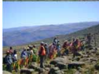
Manejos, conservación y producción de los camélidos silvestres “vicuñas”