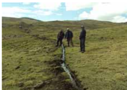
Apertura de zanjas de infiltración del proyecto "Desarrollo de las alpacas en las partes altas del Proyecto Camisea – Huaytara"