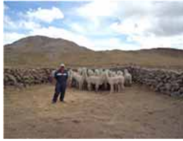
Adquisición de 12 reproductores Proyecto "Mejoramiento Genético y Desarrollo de la Crianza de Alpacas en el Distrito de Ascensión"