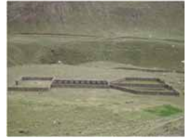
Modulo de empadre controlado - C.C. Cachimayo Proyecto "Mejoramiento Genético y Desarrollo de la Crianza de Alpacas en el Distrito de Ascensión"