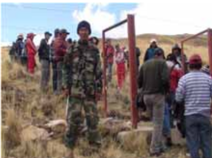
GUARDAPARQUE CUMPLIENDO SUS FUNCIONES

Población beneficiaria: Los Beneficiarios Directos serán 6,784 personas, quienes se encuentran ubicados en 47 comunidades en las provincias de Huancavelica, Castrovirreyna y Huaytara, al concluir el proyecto