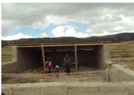
Módulos de cobertizos del proyecto "Desarrollo de las alpacas en las partes altas del Proyecto Camisea – Huaytara"

Población beneficiaria: Los Beneficiarios Directos serán 4,257 personas, al concluir el proyecto